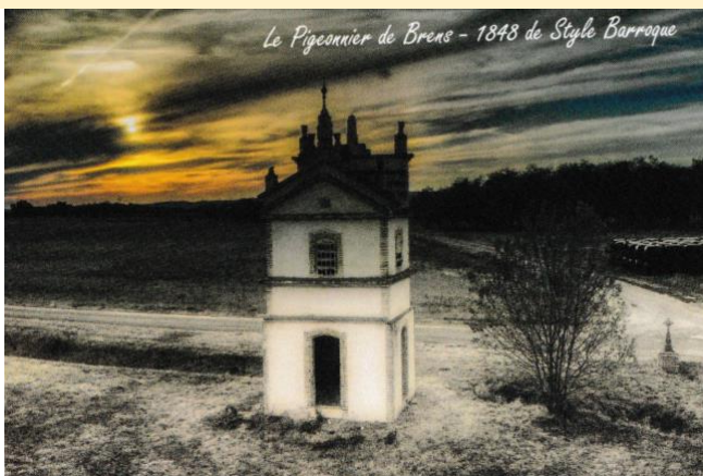
Le Pigeonnier de Brens - 1848 de Style Barroque

Pigeonnier route des stades « Style Barroque 1848 »